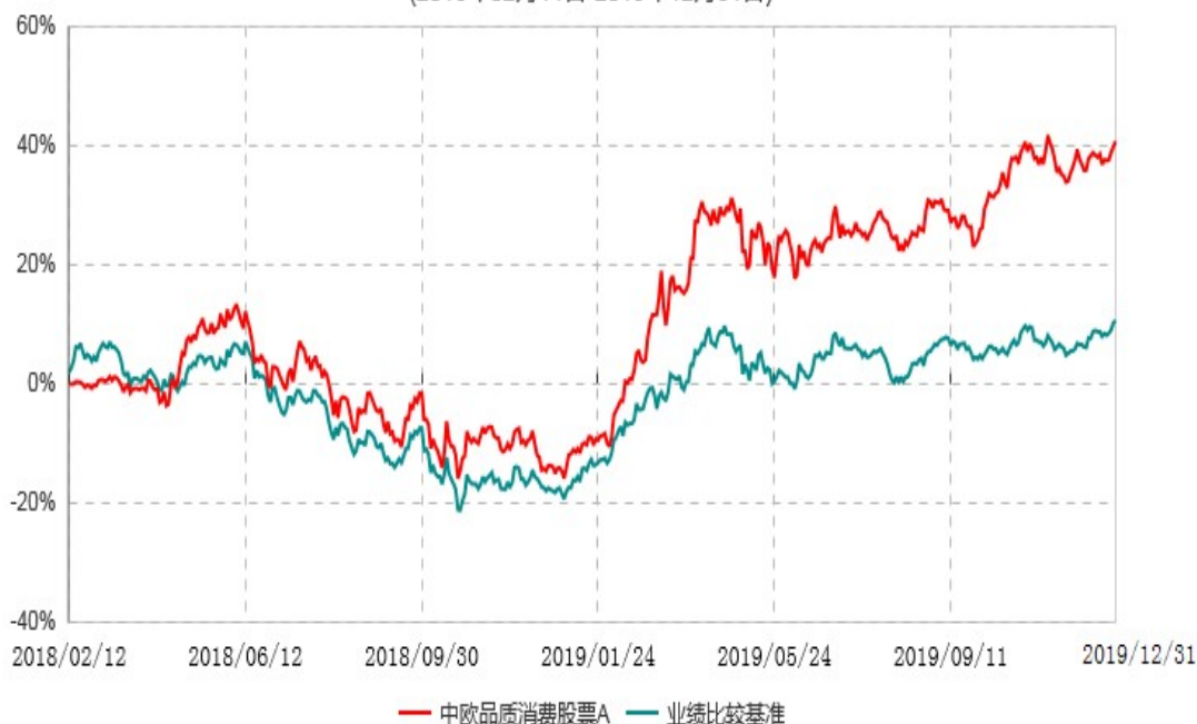
中欧品质消费股票A累计净值增长率与业绩比较基准收益率历史走势对比图 (2018年02月11日-2019年12月31日)