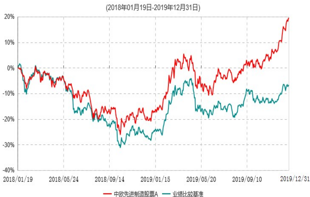
中欧先进制造股票A累计净值增长率与业绩比较基准收益率历史走势对比图