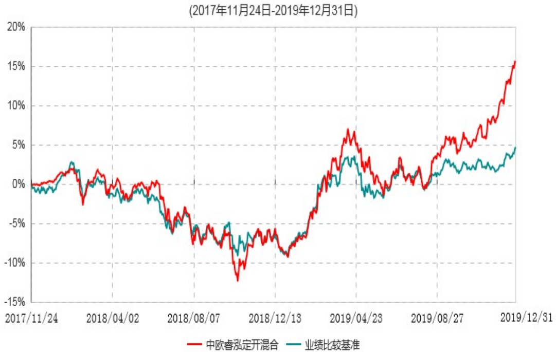
中欧睿泓定期开放灵活配置混合型证券投资基金累计净值增长率与业绩比较基准收益率历史走势对比图