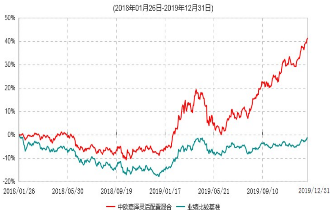
中欧嘉泽灵活配置混合型证券投资基金累计净值增长率与业绩比较基准收益率历史走势对比图