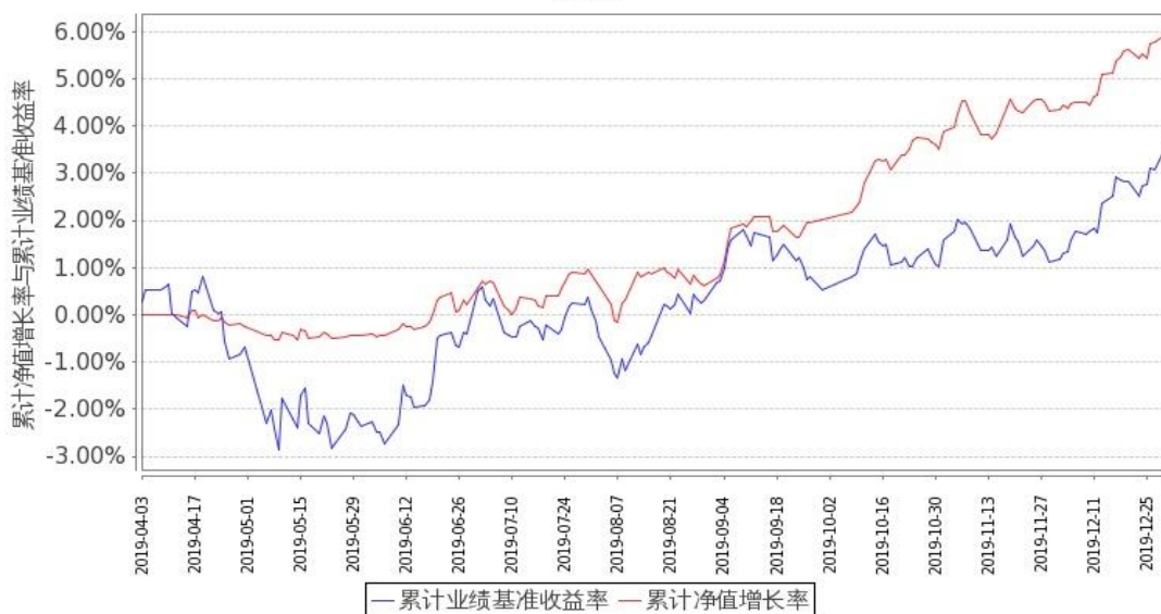
图 1：嘉实新添元定期混合 A 基金份额累计净值增长率与同期业绩比较基准收益率的历史走势对比图