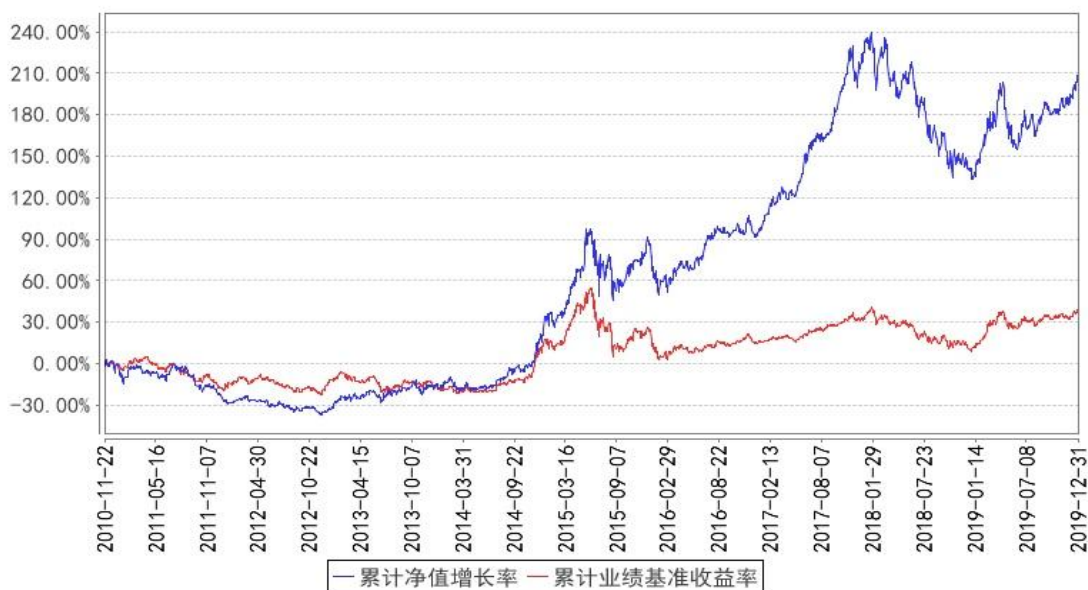
东方红6号集合累计净值增长率与同期业绩比较基准收益率的历史走势对比图