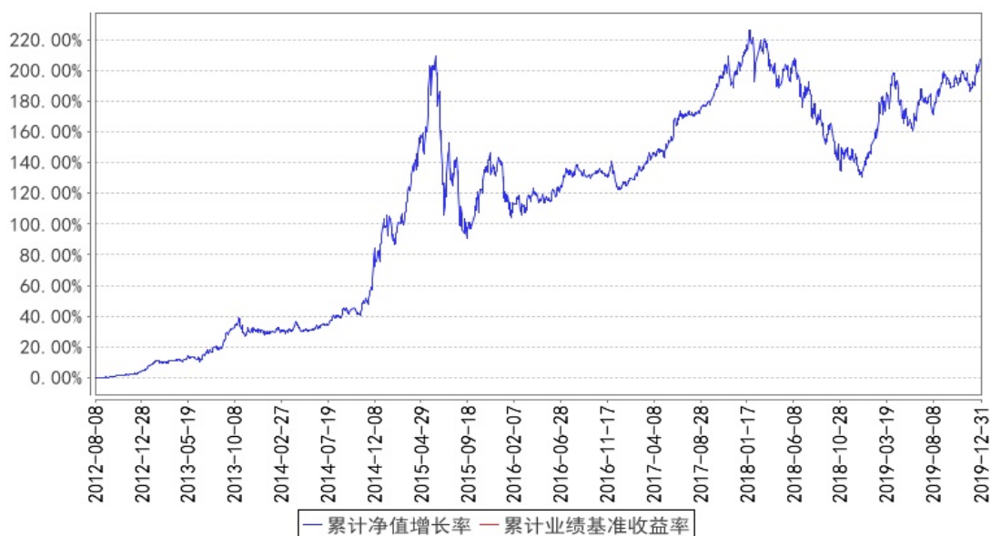
东方红新睿3号集合累计净值增长率与同期业绩比较基准收益率的历史走势对比图