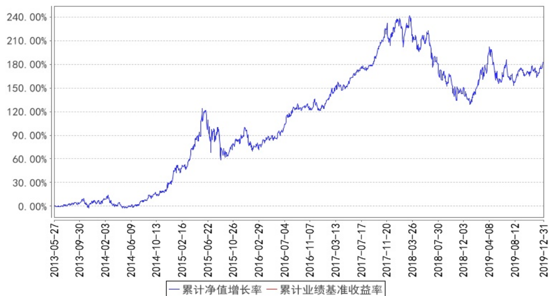
东方红内需增长集合累计净值增长率与同期业绩比较基准收益率的历史走势对比图