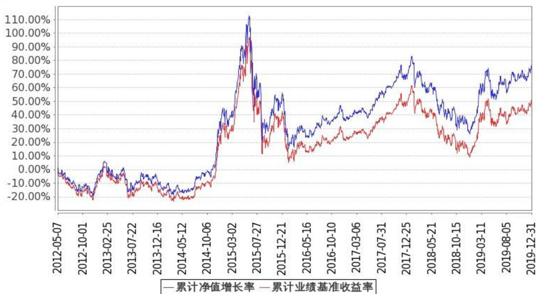
图：嘉实沪深 300ETF 基金份额累计净值增长率与同期业绩比较基准收益率的历史走势对比图