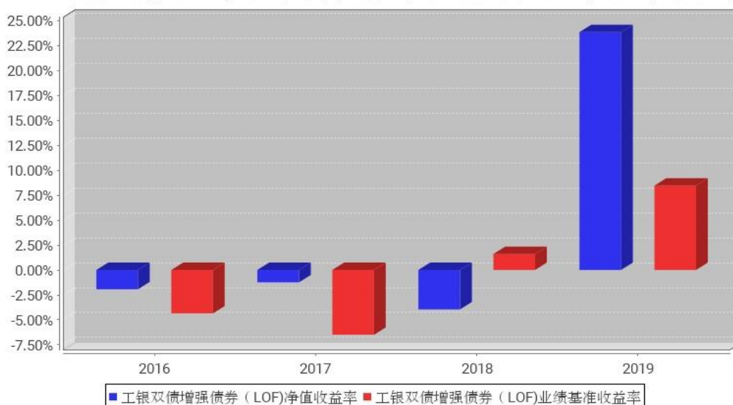
工银双债增强债券（LOF）基金每年净值增长率与同期业绩比较基准收益率的对比图