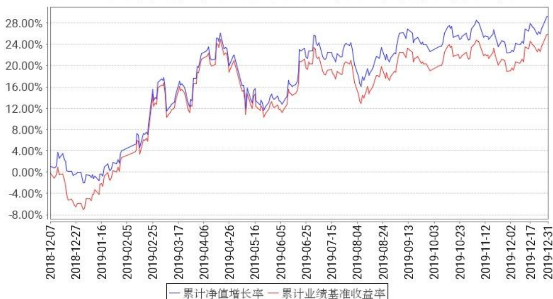
工银上50累计净值增长率与同期业绩比较基准收益率的历史走势对比图