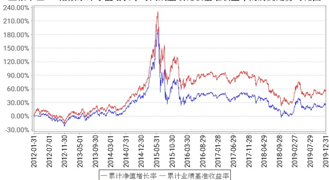
工银中证500指数累计净值增长率与同期业绩比较基准收益率的历史走势对比图