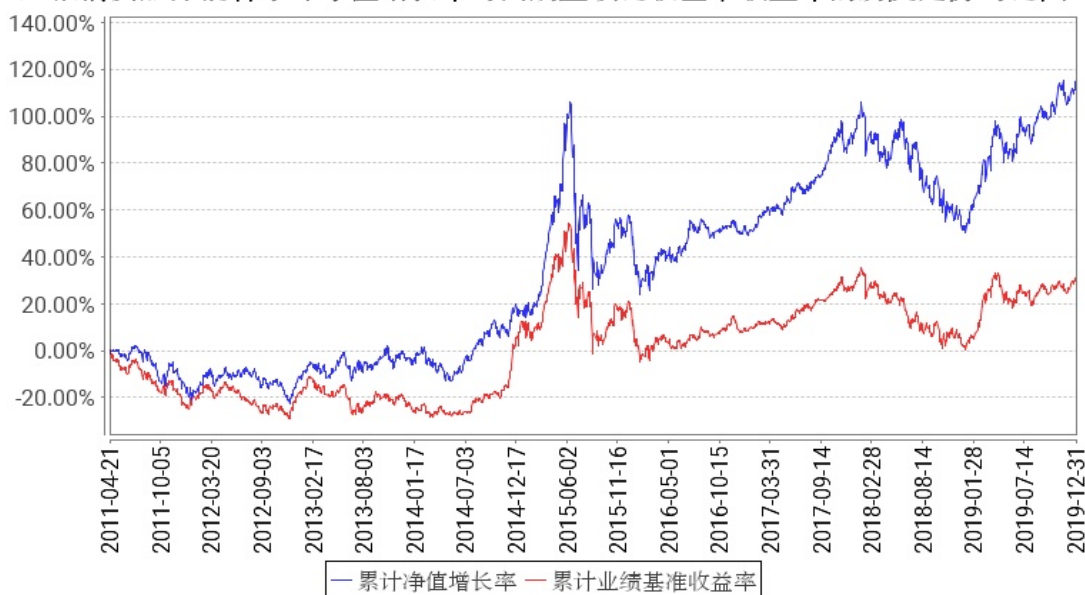
工银消费服务混合累计净值增长率与同期业绩比较基准收益率的历史走势对比图