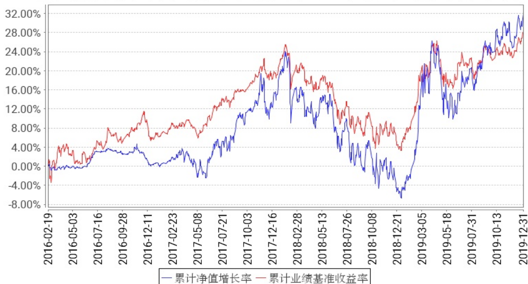
工银优质精选混合累计净值增长率与同期业绩比较基准收益率的历史走势对比图

注:1、本基金于 2016 年 2 月 19 日转型为工银瑞信优质精选混合型证券投资基金。