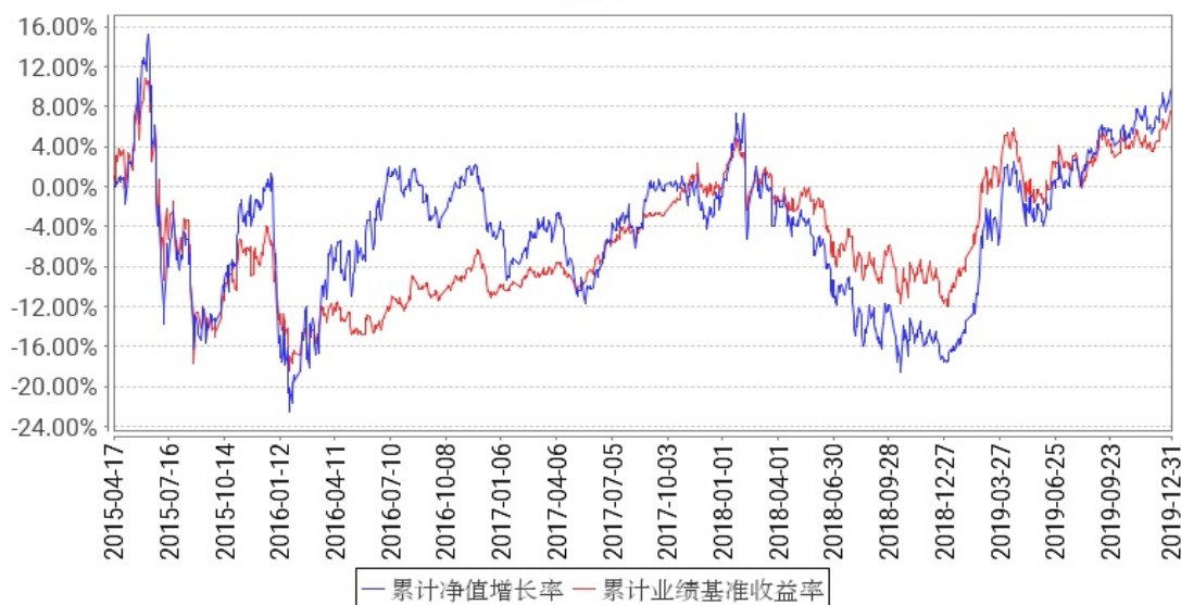
工银总回报灵活配置混合累计净值增长率与同期业绩比较基准收益率的历史走势对比图