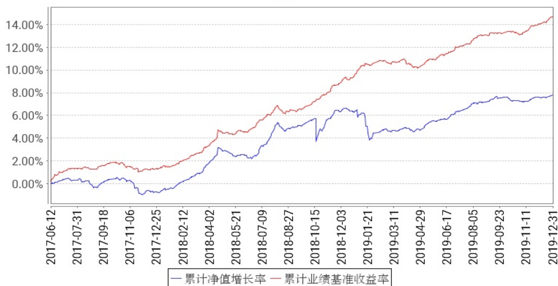
工银丰实三年定开债券累计净值增长率与同期业绩比较基准收益率的历史走势对比图