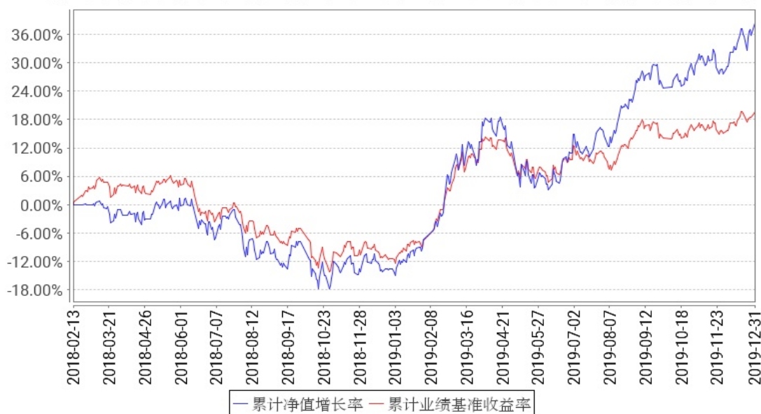
工银新生代消费混合累计净值增长率与同期业绩比较基准收益率的历史走势对比图