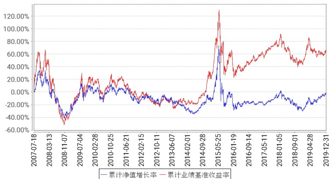
工银红利混合累计净值增长率与同期业绩比较基准收益率的历史走势对比图