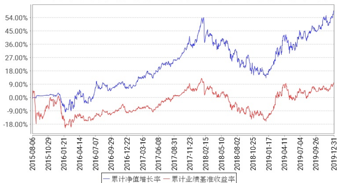
工银新蓝筹股票累计净值增长率与同期业绩比较基准收益率的历史走势对比图