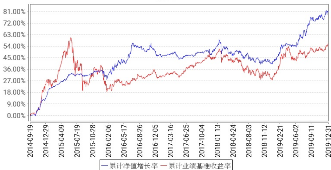
工银新财富灵活配置混合累计净值增长率与同期业绩比较基准收益率的历史走势对比图