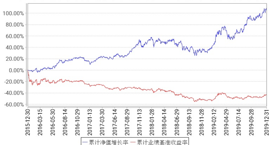
工银文体产业股票累计净值增长率与同期业绩比较基准收益率的历史走势对比图