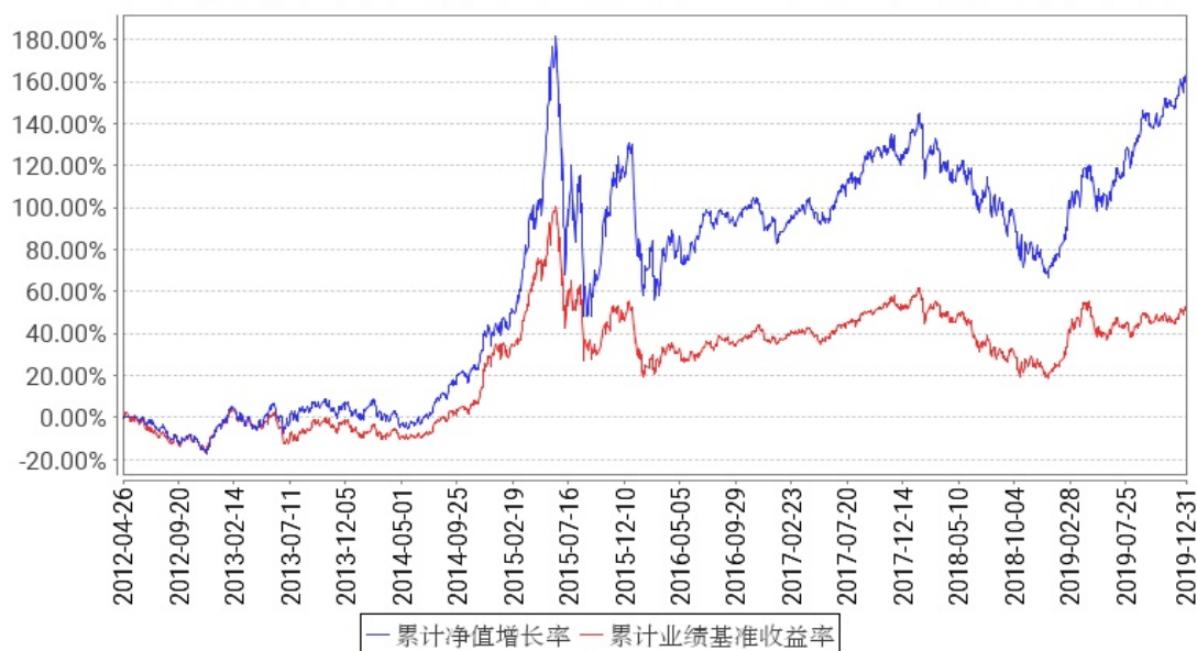
工银量化策略混合累计净值增长率与同期业绩比较基准收益率的历史走势对比图