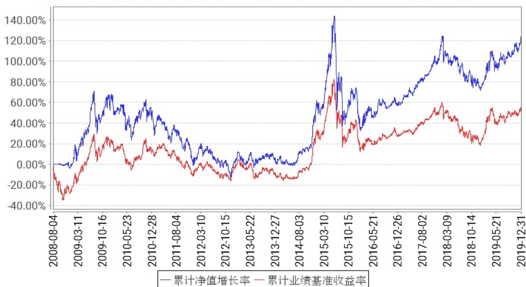
工银大盘蓝筹混合累计净值增长率与同期业绩比较基准收益率的历史走势对比图