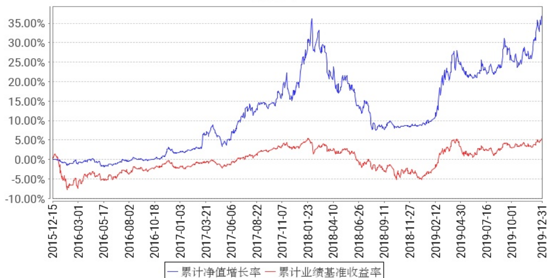
工银新趋势灵活配置混合A累计净值增长率与同期业绩比较基准收益率的历史走势对比图