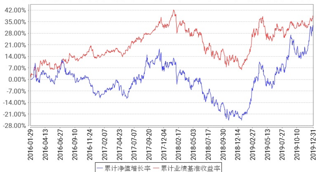
工银国家战略股票累计净值增长率与同期业绩比较基准收益率的历史走势对比图