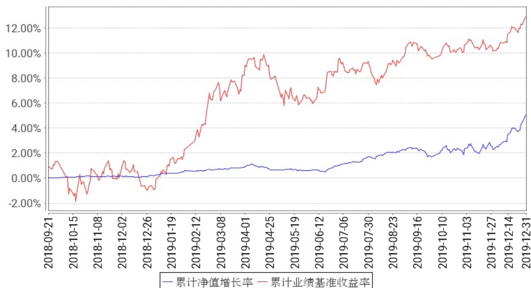
工银聚福混合A累计净值增长率与同期业绩比较基准收益率的历史走势对比图