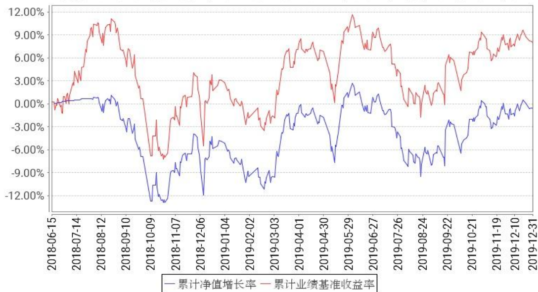
工银印度基金累计净值增长率与同期业绩比较基准收益率的历史走势对比图