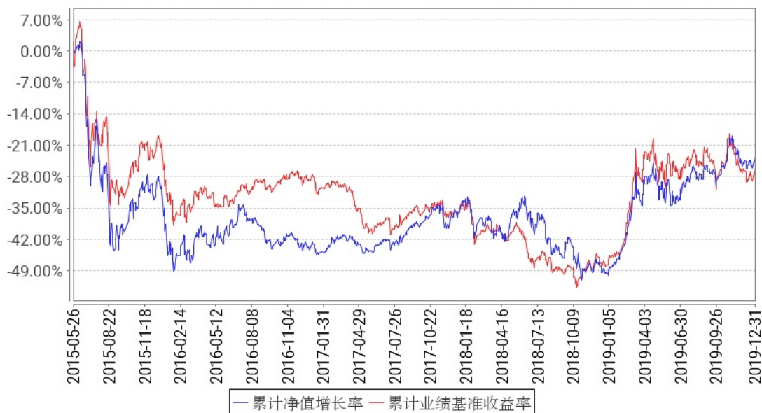
工银农业产业股票累计净值增长率与同期业绩比较基准收益率的历史走势对比图