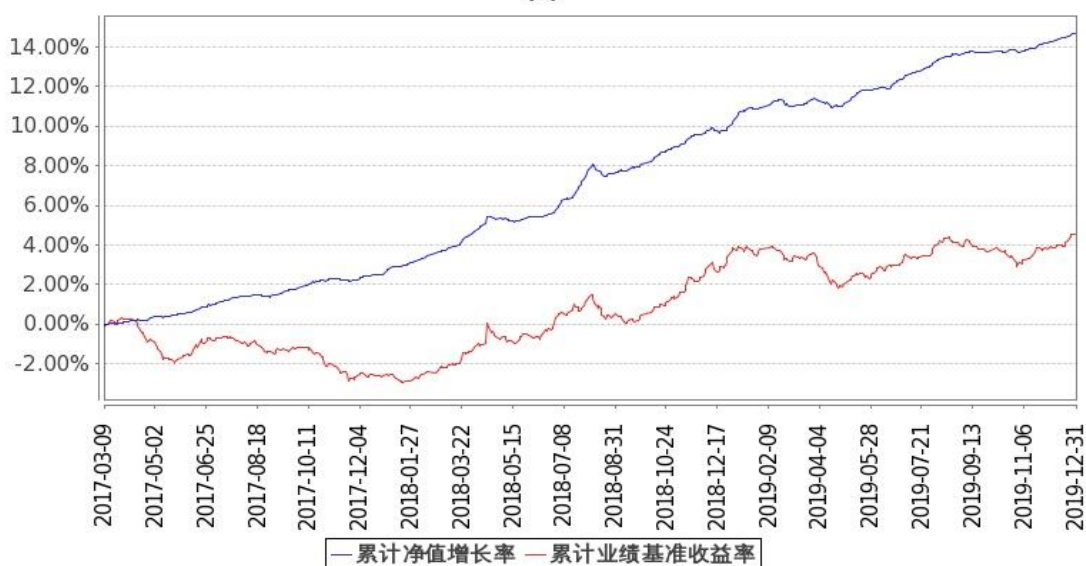
图：嘉实稳元纯债债券基金份额累计净值增长率与同期业绩比较基准收益率的历史走势对比图