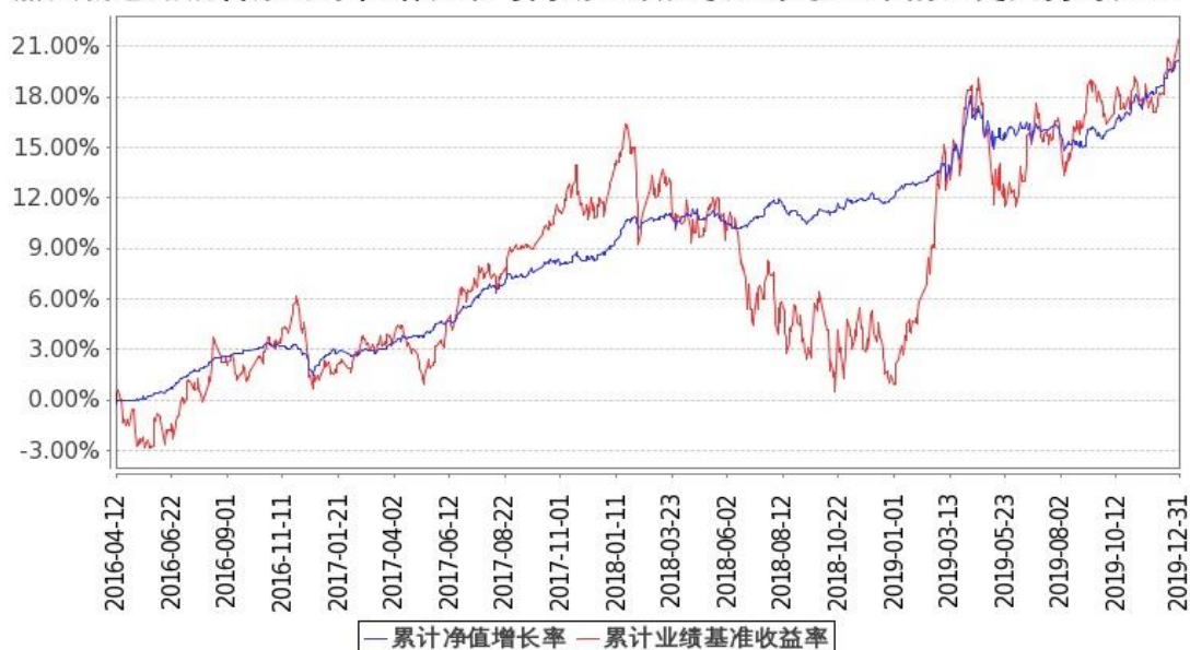
图：嘉实新思路混合基金份额累计净值增长率与同期业绩比较基准收益率的历史走势对比图