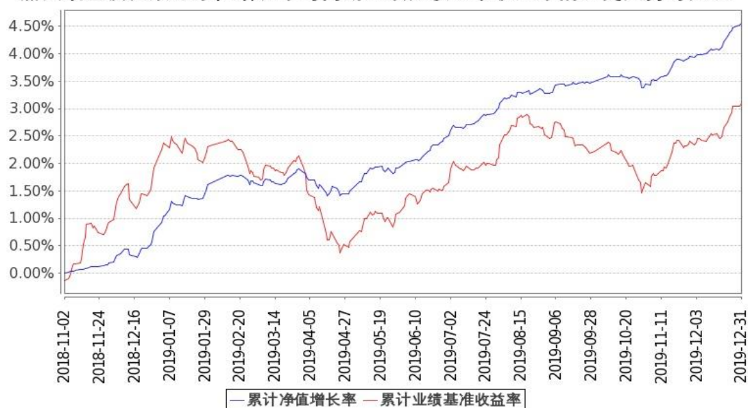
图：嘉实致盈债券基金份额累计净值增长率与同期业绩比较基准收益率的历史走势对比图