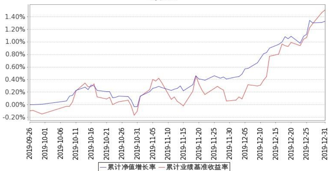
图：嘉实致安3个月定期债券基金份额累计净值增长率与同期业绩比较基准收益率的历史走势对比图