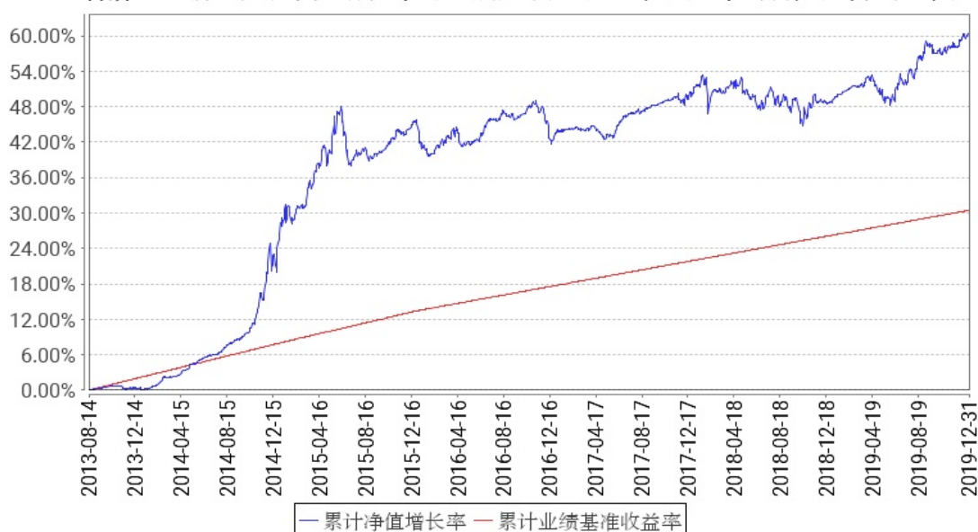
工银瑞信月月薪A累计净值增长率与同期业绩比较基准收益率的历史走势对比图