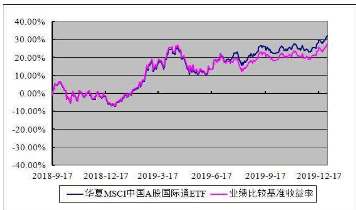
华夏 MSCI 中国 A 股国际通交易型开放式指数证券投资基金 基金份额累计净值增长率与业绩比较基准收益率的历史走势对比图 (2018 年 9 月 17 日至 2019 年 12 月 31 日)

注：根据本基金的基金合同规定，本基金自基金合同生效之日起 6 个月内使基金的投资组合比例符合本基金合同中投资范围、投资限制的有关约定。