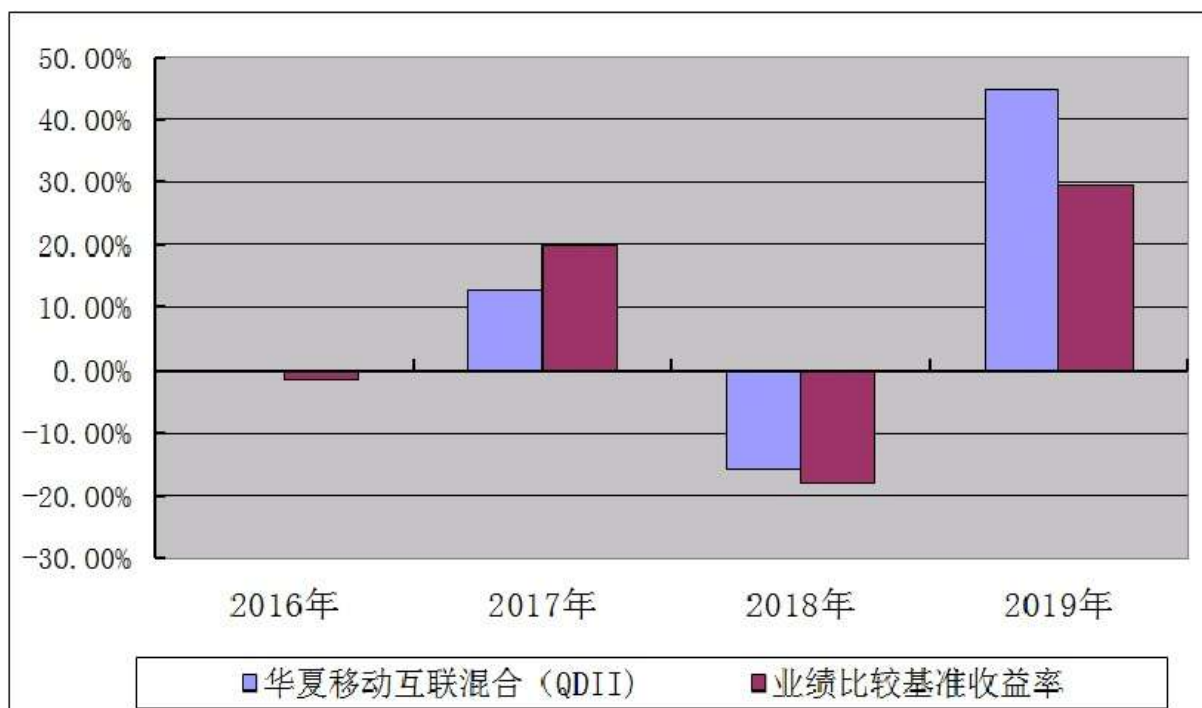
华夏移动互联灵活配置混合型证券投资基金（QDII） 基金每年净值增长率及其与同期业绩比较基准收益率的对比图

注：本基金合同于 2016 年 12 月 14 日生效，合同生效当年按实际存续期计算，不按整个自然年度进行折算。