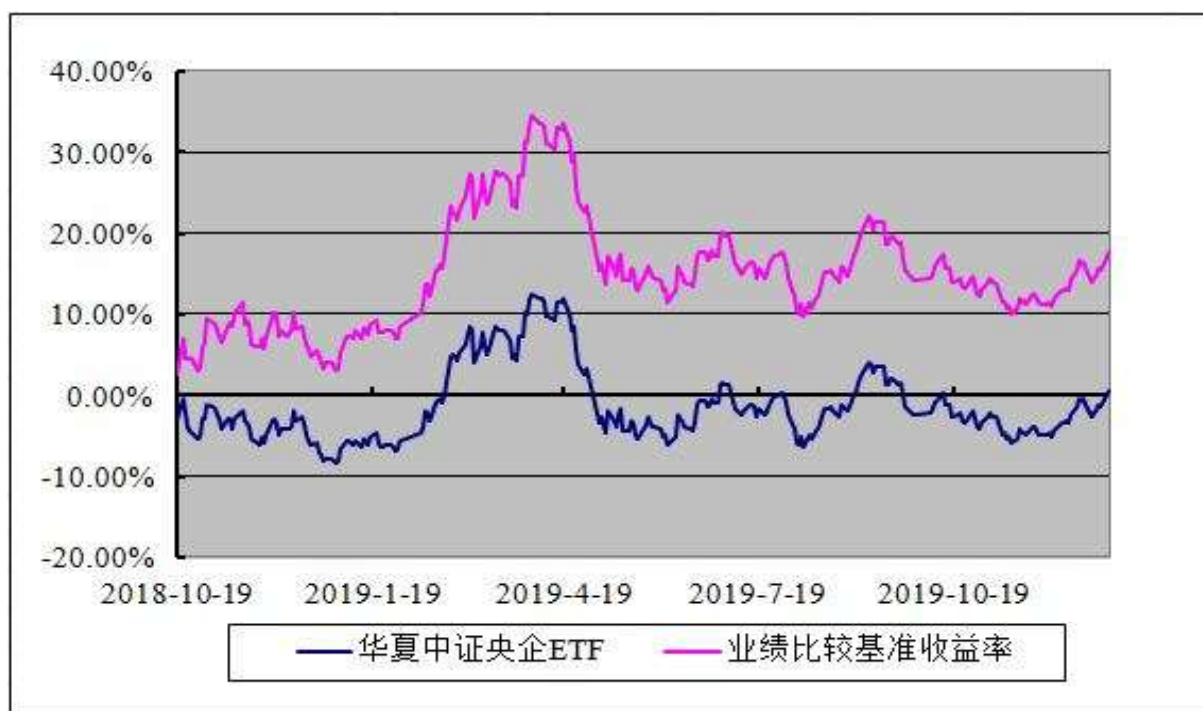
华夏中证央企结构调整交易型开放式指数证券投资基金 基金份额累计净值增长率与业绩比较基准收益率的历史走势对比图 (2018 年 10 月 19 日至 2019 年 12 月 31 日)

注：根据本基金的基金合同规定，本基金自基金合同生效之日起 6 个月内使基金的投资组合比例符合本基金合同中投资范围、投资限制的有关约定。