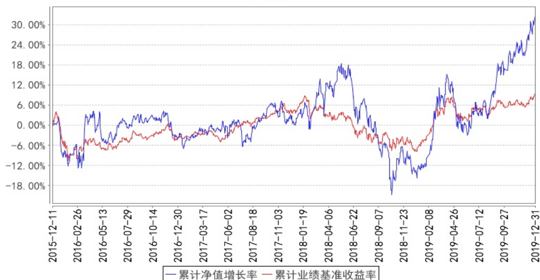
融通成长30灵活配置混合累计净值增长率与同期业绩比较基准收益率的历史走势对比图