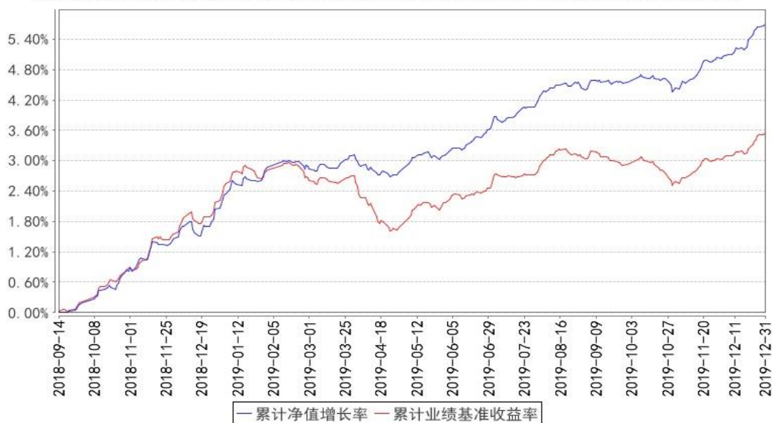
融通增悦债券累计净值增长率与同期业绩比较基准收益率的历史走势对比图

注:本基金的建仓期为自合同生效日起6个月,截止本报告期末,各项资产配置比例符合合同约定。