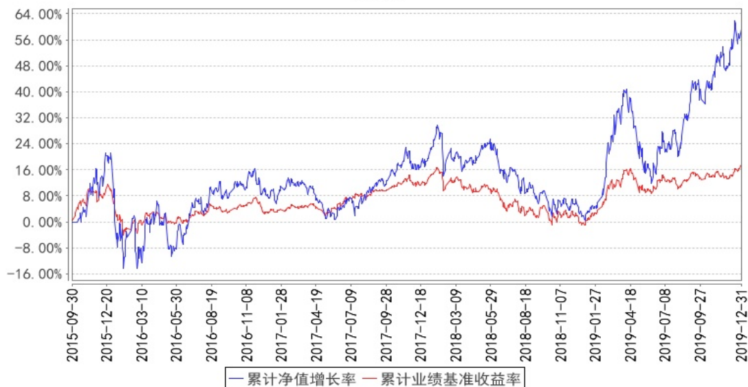
融通跨界成长灵活配置混合累计净值增长率与同期业绩比较基准收益率的历史走势图