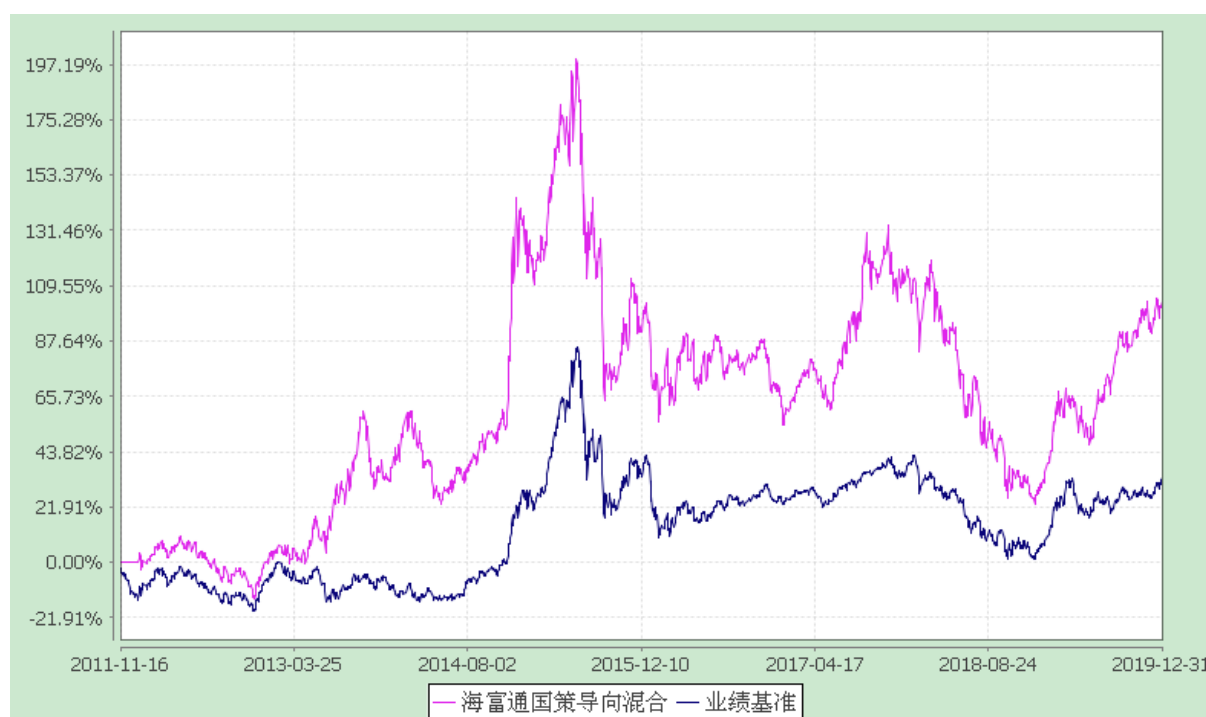
海富通国策导向混合型证券投资基金 份额累计净值增长率与业绩比较基准收益率的历史走势对比图 (2011 年 11 月 16 日至 2019 年 12 月 31 日)

注：按照本基金合同规定，本基金建仓期为基金合同生效之日起六个月。截至报告期末本基金的各项投资比例已达到基金合同第十四部分（二）投资范围、（七）投资限制中规定的各项比例。