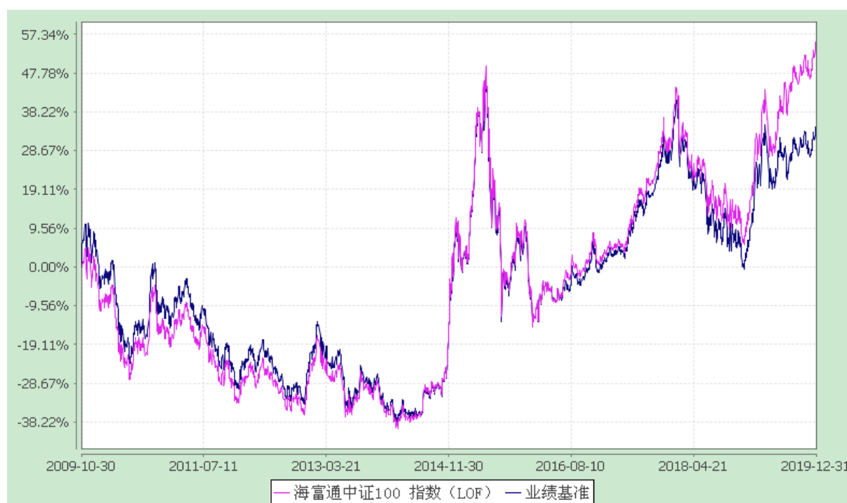
海富通中证 100 指数证券投资基金 (LOF) 份额累计净值增长率与业绩比较基准收益率的历史走势对比图 (2009 年 10 月 30 日至 2019 年 12 月 31 日)

注：按照本基金合同规定，本基金建仓期为基金合同生效之日起六个月。建仓期满至今，本基金投资组合均达到本基金合同第十五条（二）、（七）规定的比例限制及本基金投资组合的比例范围。