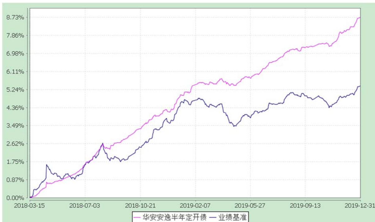
自基金合同生效以来份额累计净值增长率与业绩比较基准收益率的历史走势对比图 (2018 年 3 月 15 日至 2019 年 12 月 31 日)