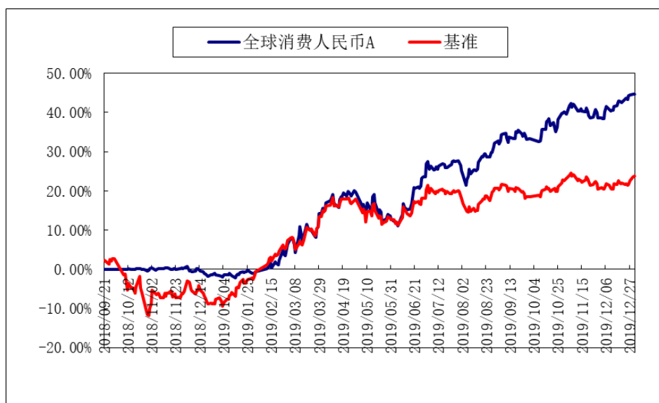
添富全球消费混合（QDII）人民币 C