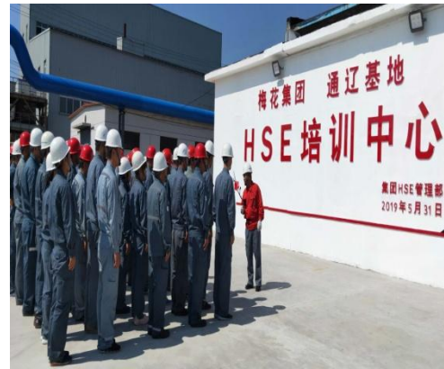
通辽基地 HSE 培训中心