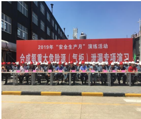
基地安全专项演习

安全实感操作的综合实训平台。为增强员工安全意识，提高安全操作规范，仅上半年公司组织涉及职业健康、特种作业、消防知识等方面的各类安全培训 386 场次，涉及 27058 人次。在安全月系列活动中，公司开展了安全知识竞赛、HSE 理念演讲比赛、趣味比赛等多种形式的活动，增加员工参与的主动性、趣味性和实用性。