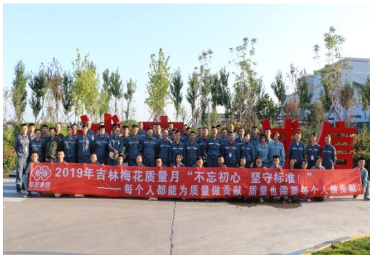
吉林基地“质量月”启动会

的凝聚力，通过开展以下活动：1) 通过构建质量宣传阵地，营造质量文化氛围；2) GMP 管理实施挂牌，树立精制标杆车间；3) 以“质量零容忍”为主题，开展全员演讲活动；4) 通过专业技能大比武，展现质检人的风采等，在全公司范围内营造了人人关心质量，人人重视质量的良好氛围。质量管理在 2019 年有了较大的提升，质量管理团队从事后管控向事前预防转变，解决了苏氨酸、赖氨酸结块问题，异物管理也取得了一定成效。