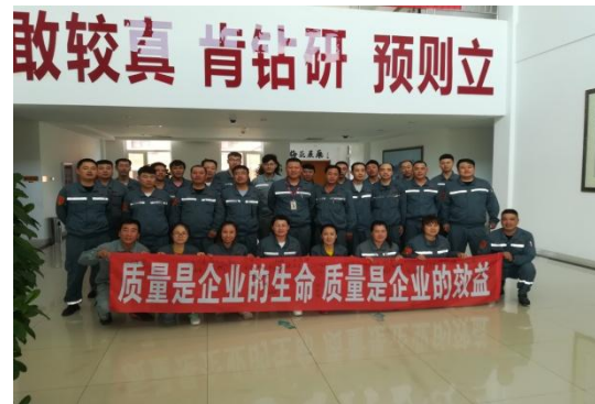
通辽基地“质量月”宣传活动