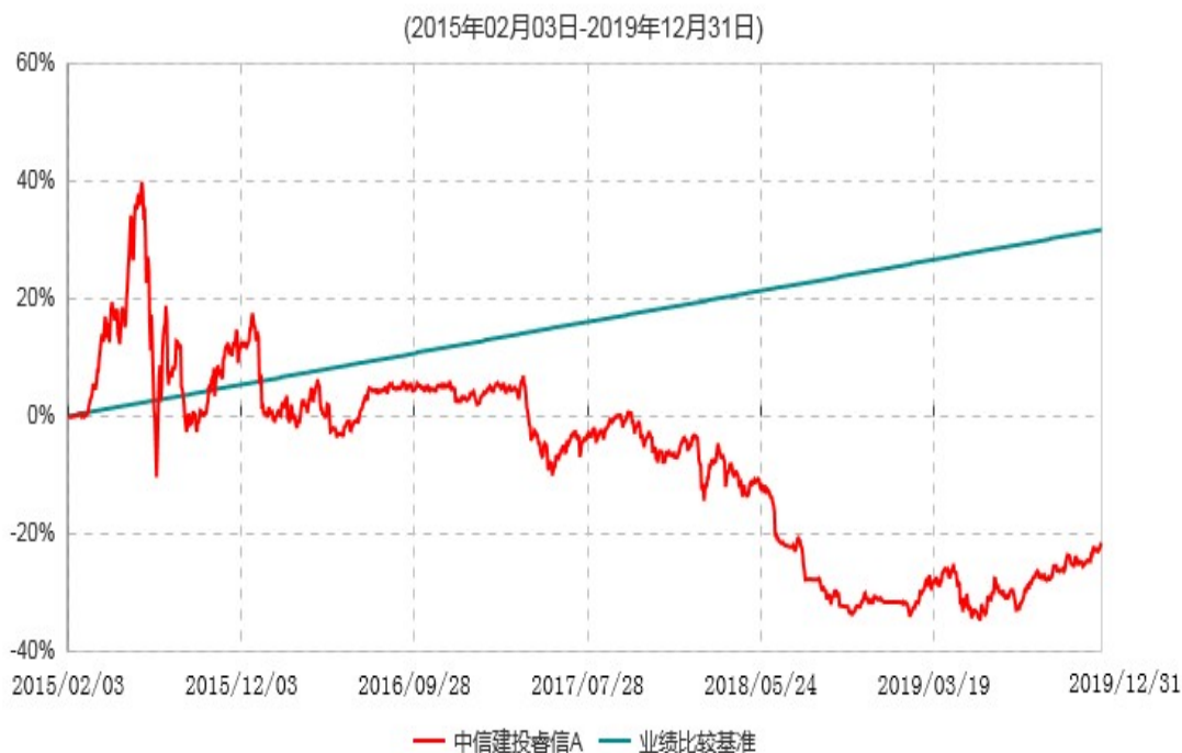
中信建投睿信C累计净值增长率与业绩比较基准收益率历史走势对比图