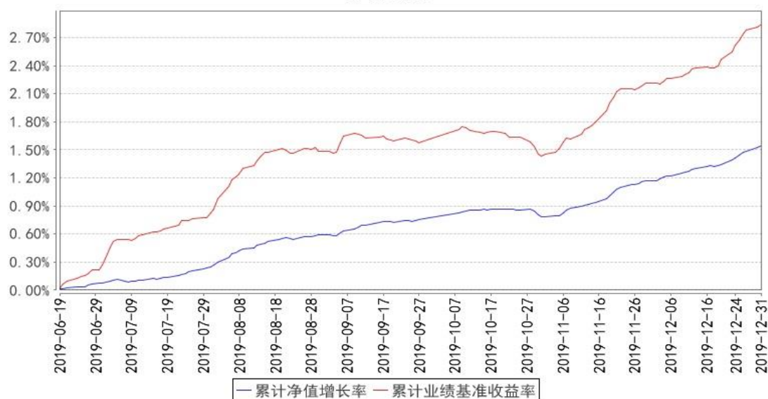
鹏华尊晟定期开放发起式债券累计净值增长率与同期业绩比较基准收益率的历史走势对比图