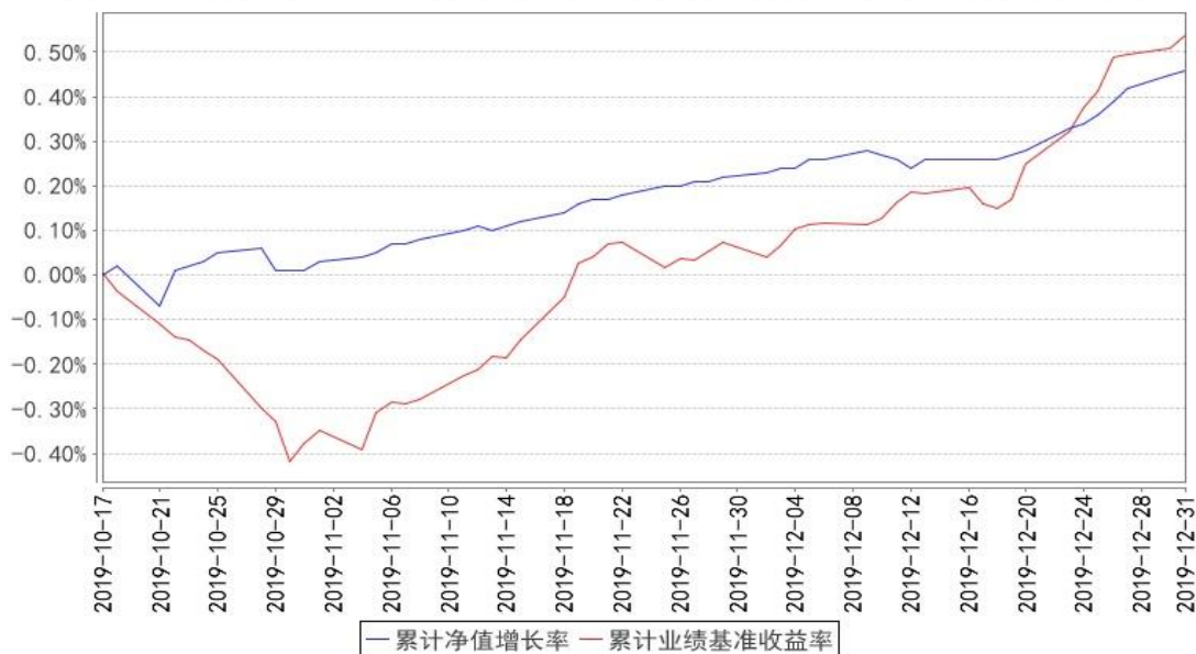
鹏华丰庆债券累计净值增长率与同期业绩比较基准收益率的历史走势对比图

注:1、本基金基金合同于 2019 年 10 月 17 日生效。2、截至建仓期结束,本基金的各项投资比例已达到基金合同中规定的各项比例。