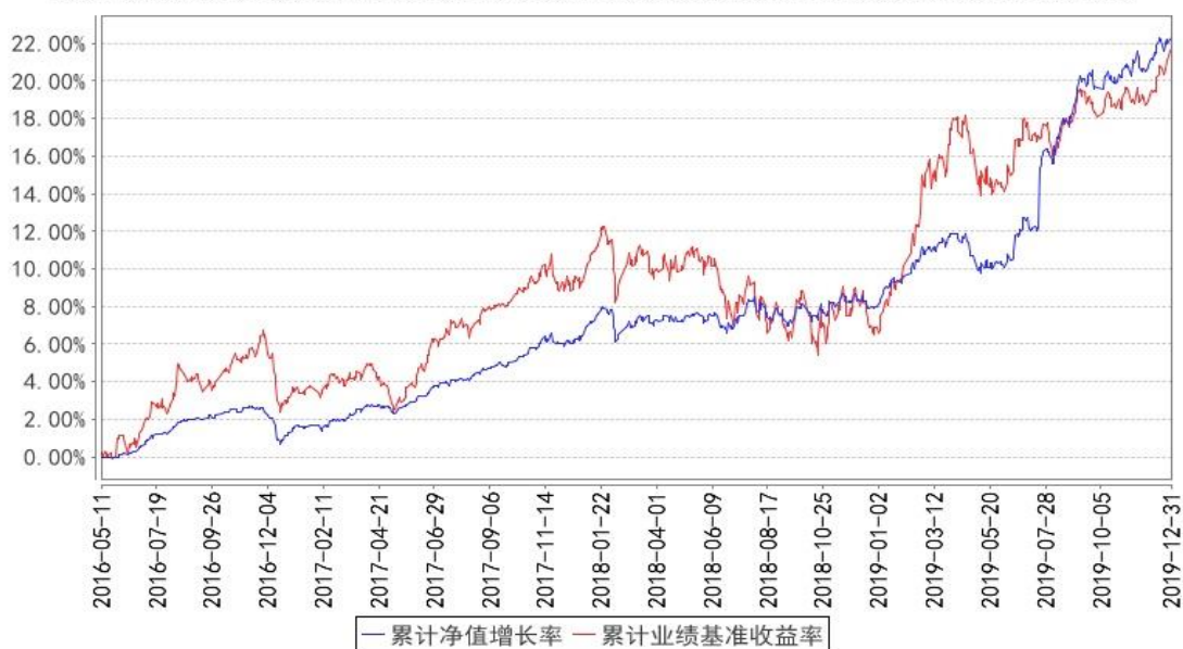
鹏华兴利混合累计净值增长率与同期业绩比较基准收益率的历史走势对比图

注：1、本基金基金合同于 2016 年 05 月 11 日生效。2、截至建仓期结束，本基金的各项投资比例已达到基金合同中规定的各项比例。