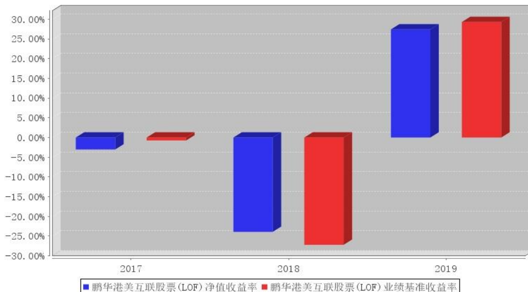
鹏华港美互联股票 (LOF) 基金每年净值增长率与同期业绩比较基准收益率的对比图