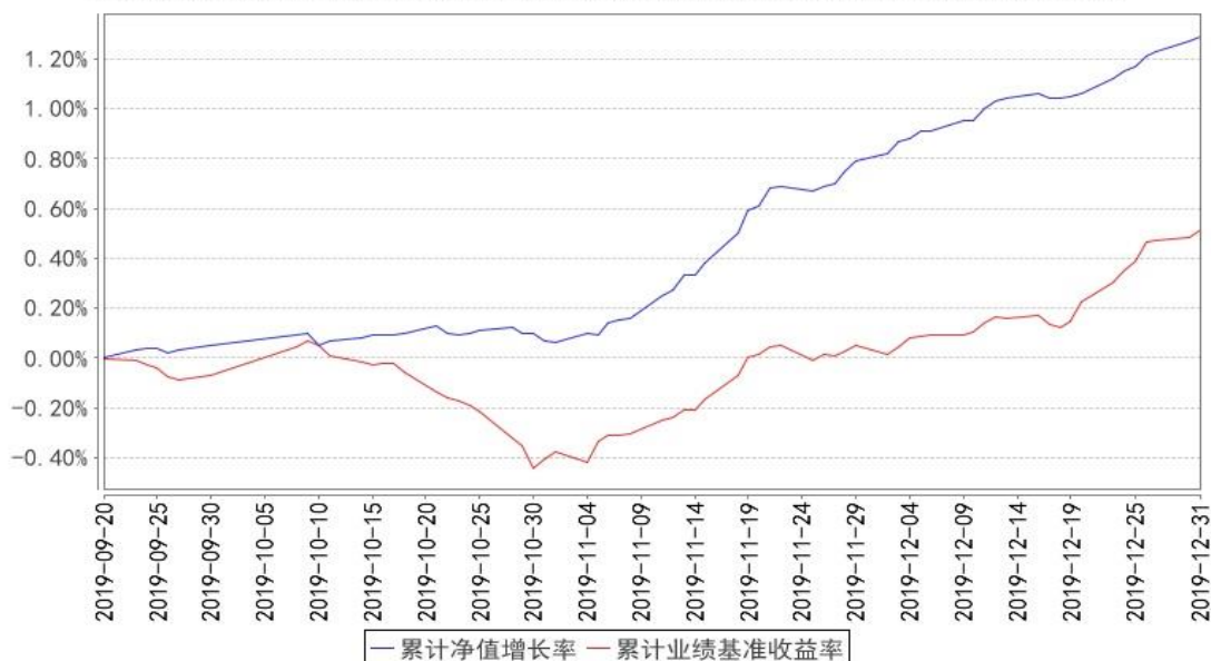
丰鑫债券累计净值增长率与同期业绩比较基准收益率的历史走势对比图